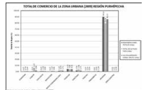
Ver gráfico 2

Así mismo para las remuneraciones totales el municipio de Chilchota concentró el 0.6 por ciento, el total de activo fijos concentró el 1.4 por ciento y para el valor agregado censal bruto el 0.8 por ciento. En Nuevo Parangaricutiro las remuneraciones totales fueron de 1.2 por ciento, el total de activos fijos concentro el 2.2 por ciento y el valor agregado censal bruto concentro el 1.7 por ciento. Paracho concentró el 4.2 por ciento de las remuneraciones totales,