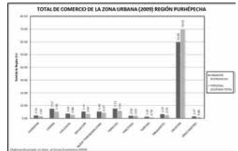
Ver gráfico 1

En cuanto al municipio de Chilchota las unidades económicas concentró el 3.6 por ciento y el 2.8 por ciento para el personal ocupado. En Nuevo Parangaricutiro se concentró el 5.3 por ciento de las unidades económicas y el 4.3 por ciento del personal ocupado. Paracho registró el 7.7 por ciento de las unidades económicas y para el personal ocupado fue de 5.9 por ciento y para el municipio de Uruapan se concentró el 59.8 por ciento de las unidades económicas y el 70.0 por ciento del personal ocupado. (Ver gráfico 1)